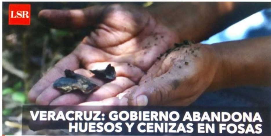
Manos del postulante desenterrando restos en la fosa de la gallera en Tihuatlan Veracruz (2017)

Buscarlos y encontrarlos, devolverlos a sus familias es la expectativa y el compromiso central por el que debemos trabajar la sociedad civil, el Estado y las familias.